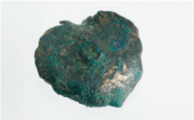
Fig. 3 - Socchieve, Nonta: porzione di lamina leggermente convessa (Civici Musei di Udine, n. inv. 811). - Socchieve, Nonta: fragment of thin lamina, slightly convex (Civic Museums in Udine, n. inv. 811).